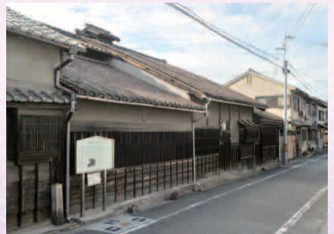
てっぽうかじやしき 鉄砲鍛冶屋敷 (3日のみ)