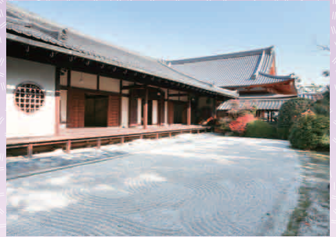
なんしゅうじ 南宗寺