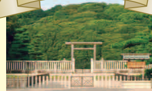
仁徳天皇陵古墳拜所前

百舌鳥古墳群ワンストップ窓口 TEL.0120-099-771(受付時間9:00~17:30)