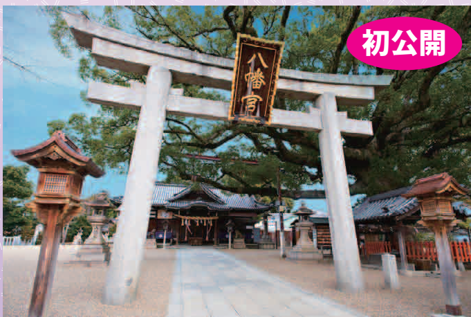
もす はちまんぐう 百舌鳥八幡宮