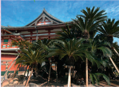
みょうこくじ 妙國寺 (12日夜間コンサート開催 [有料]) ※夜間ライトアップあり (11日のみ)