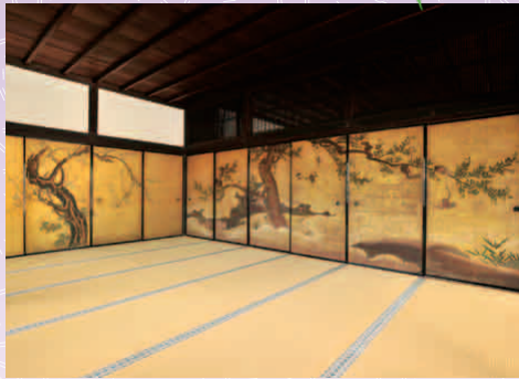
たいあんじ 大安寺