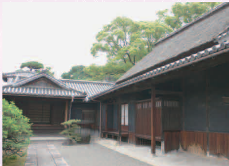
たかばやしけいじゅうたく 高林家住宅 (5日のみ)