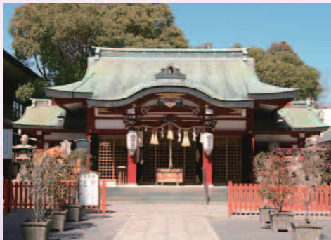
あぐちじんじや 開口神社 (3日コンサート開催 [無料])