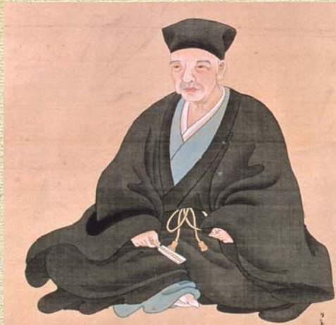
千利休 大永2年(1522年)～天正19年(1591年)

仁徳天皇陵古墳・履中天皇陵古墳・反正天皇陵古墳の百舌鳥三陵を中心に大小47基の古墳が残り、東西・南北とも4kmほどの範囲で広がっています。