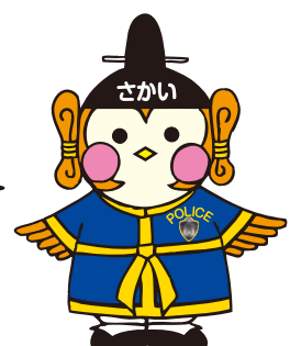
堺警察署 マスコットキャラクター 「さかいまもる」