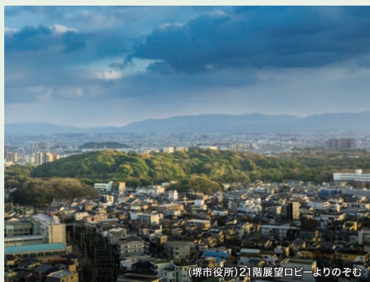
(堺市役所)21階展望ロビーよりのぞむ

ユネスコの世界遺産条約に基づいて登録された文化遺産・自然遺産・複合遺産のこと。登録には顕著な普遍的価値を有することなどの必要条件があり、日本では「富士山」「原爆ドーム」をはじめ文化遺産18件、「屋久島」などの自然遺産4件が登録されています(2018年9月現在)。