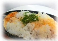
• 铁板鸡蛋拌饭 400 円 或者 生鸡蛋拌