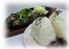
• 饭团 300 円