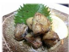
• 烤鸡屁股 380 円