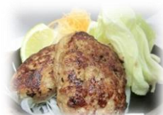
• 鸡肉汉堡 680 円 用洋葱和黄油嫩煎而成