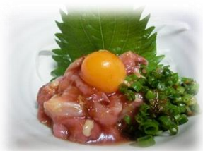
• 生拌鸡肉 880 円