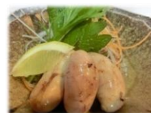
• 稀少 烤精巢 580 円 (附赠橙醋)