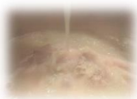
• 鸡汤 280 円 好吃的根本停不下来