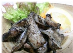
• 烤鸡软骨 580 円