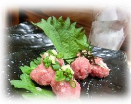
• 生肉丸子 580 円