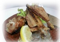
• 烤碎鸡翅 430 円