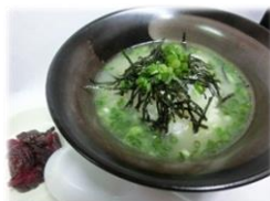
• 鸡汤泡饭 400 円 本店特色