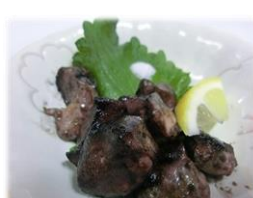
• 稀少 烤鸡胗 580 円