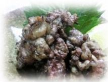
• 稀少 烤鸡肾 580 円