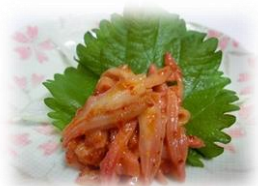
• 香辣味増鸡冠 300 円