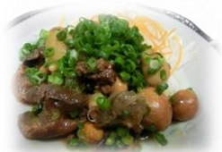
• 味増煮鸡杂 480 円