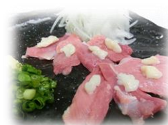
• 稀少 鸡腿手刺身 880 円