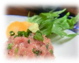
• 香辣味增鸡肉 680 円