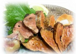
• 稀少 烤鸡肝 780 円