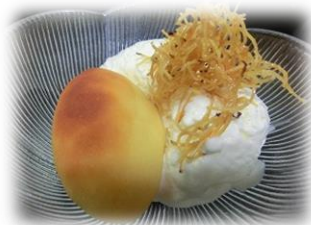
• 日式炸和果子、冰淇淋 380 円 把日式甘薯点心和西式甜点合二为一的 创始人之一