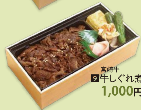
宮崎牛 9 牛しぐれ煮弁当 1,000円 (1,080円)