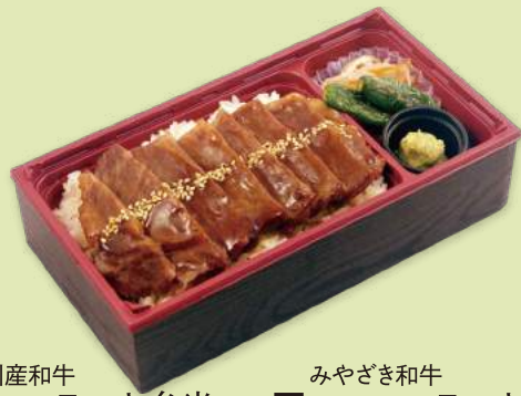
九州産和牛 5 ヘレスステーキ弁当 3,500円 (3,780円)