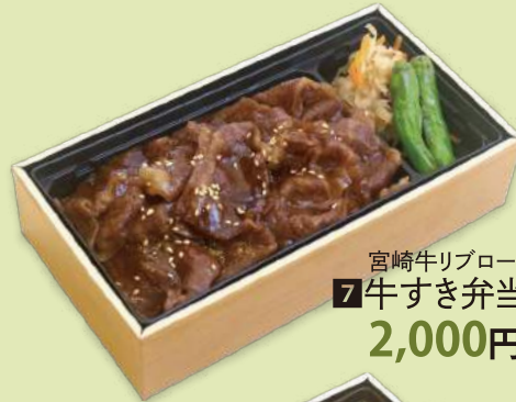
宮崎牛リブロース 7 牛すき弁当 2,000円 (2,160円)