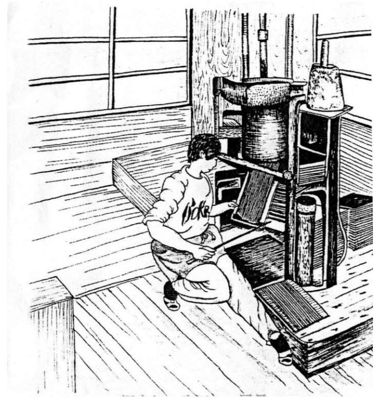
押し出し・盆切り風景